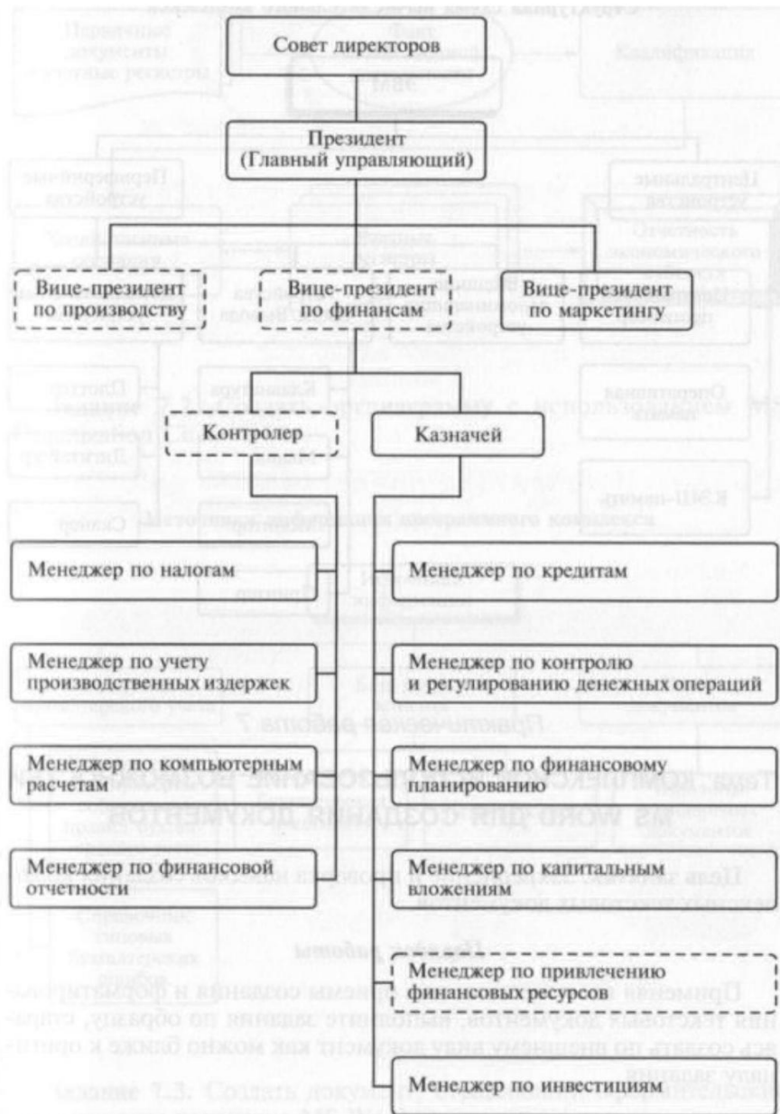
Рисунок 1. Оргдиаграмма.

Создайте оргдиаграмму по образцу (рис. 3).