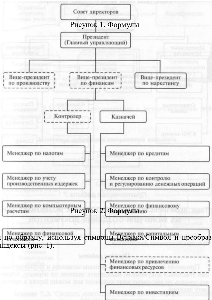
Рисунок 1. Формулы